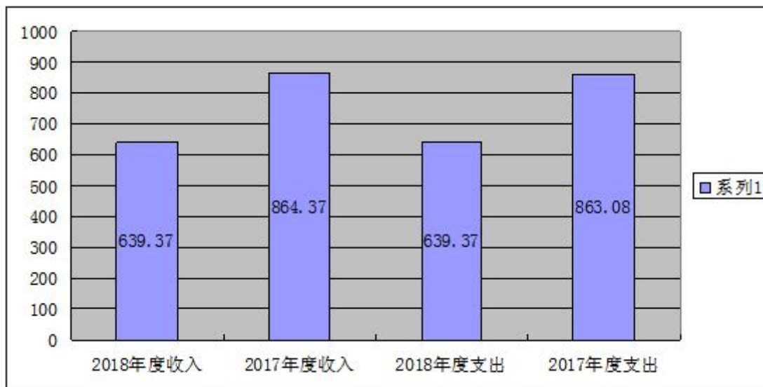
图 3：2017-2018 年财政拨款收支情况